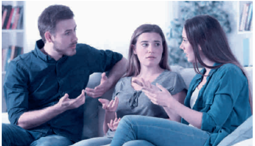
Kommt es zum Streit zwischen den Erben, muss der Willensvollstrecker schlichten.

Der Willensvollstrecker setzt den letzten Willen des Erblassers um. Dafür stellt er als Erstes ein Inventar auf, das er laufend nachführt. Er verwaltet die Erbschaft bis zur Teilung und muss darauf achten, dass das Vermögen erhalten bleibt. Er bezahlt die Schulden des Erblassers inklusive der Todesfallkosten und treibt offene Forderungen ein. Zur Verwaltung gehören auch die laufenden Geschäfte, beispielsweise muss er sich um den Unterhalt von Liegenschaften kümmern, laufende Verträge kündigen oder allenfalls die Liquidation einer Einzelunternehmung umsetzen. Er ist verantwortlich für die Erstellung der