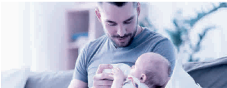
Vaterschaftsurlaub: innert sechs Monaten nach der Geburt zu beziehen.

Das Unternehmen muss dem Vater zehn arbeitsfreie Tage gewähren und hat für diese Zeit Anspruch auf 14 Taggelder. Es ist Sache des Arbeitgebers, bei der Ausgleichskasse – welche auch die EO-Beiträge abrechnet – den Antrag auf die Vaterschaftsentschädigung zu stellen. Der Antrag sollte aber erst gestellt werden, wenn der Arbeitnehmer den ganzen Vaterschaftsurlaub bezogen hat und der Arbeitgeber dies mit dem Antrag bestätigen kann. Die Auszahlung der Vaterschaftsentschädigung erfolgt dann nachgelagert